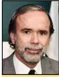
Expresidente del Consejo Nacional Agropecuario.