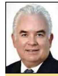
Director General del Consejo Nacional Agropecuario