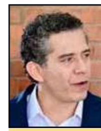
Consultor internacional, conferencista y analista senior data-driven