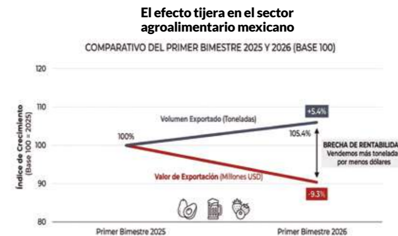
Fuente: Elaboración con datos de la Secretaría de Agricultura y Desarrollo Rural (SADER) y el Servicio de Información Agroalimentaria y Pesquera. Datos correspondientes al primer bimestre de 2026.

El superávit sigue presente, pero su solidez es cada vez menor. Si no se corrige el rumbo, existe el riesgo de que deje de ser una ventaja estructural y pase a ser un dato histórico.